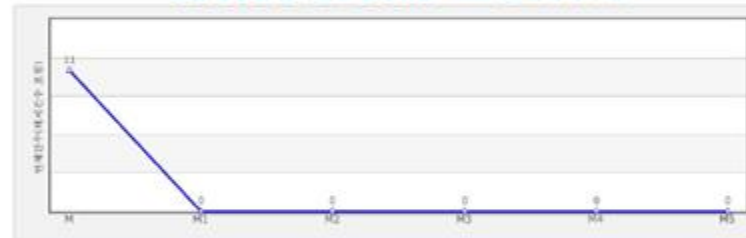
월별 금융권 단기연체 발생현황 - KED (연체해제이력)