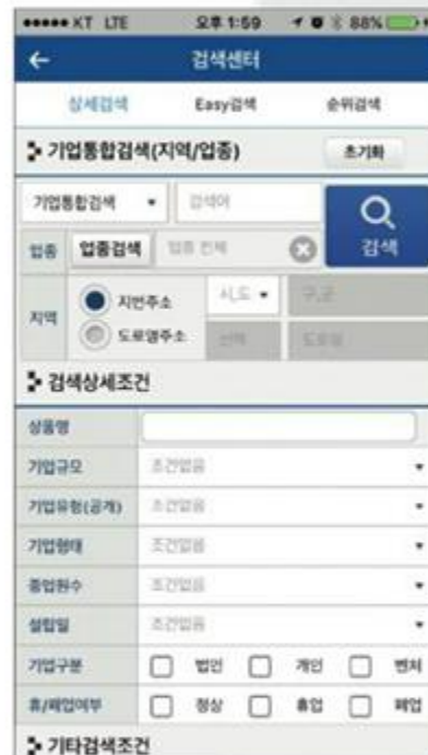
거래처발굴 및 검색